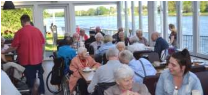
Gemeinsames Kaffeetrinken mit Aussicht in den „Brückenterrassen“

Anschließend kehrten wir zu Kaffee und Torte in die „Brückenterrassen“ in Rendsburg ein. Voller neuer Eindrücke entwickelten sich interessante Gespräche.